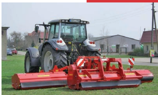
Heck 3-Punkt Version