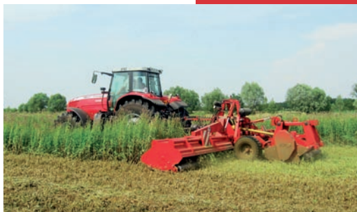
gezogen mit Fahrwerk